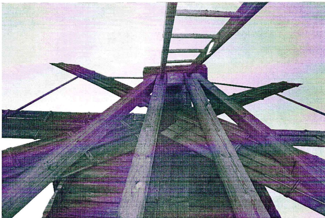
«Мельница ветряная Биканина с острова Волкостров». Республика Карелия, Медвежьегорский район, о.Кижь. Крылья. Дата: 2016 г.