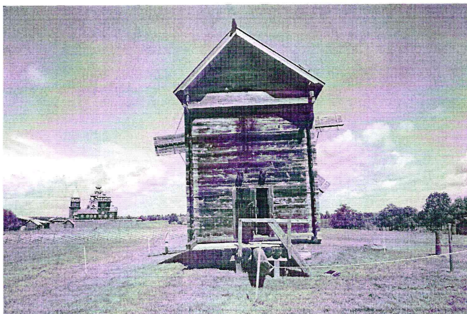
«Мельница ветряная Биканина с острова Волкостров». Республика Карелия, Медвежьегорский район, о.Кижь. Южный фасад. Дата: 2016 г.