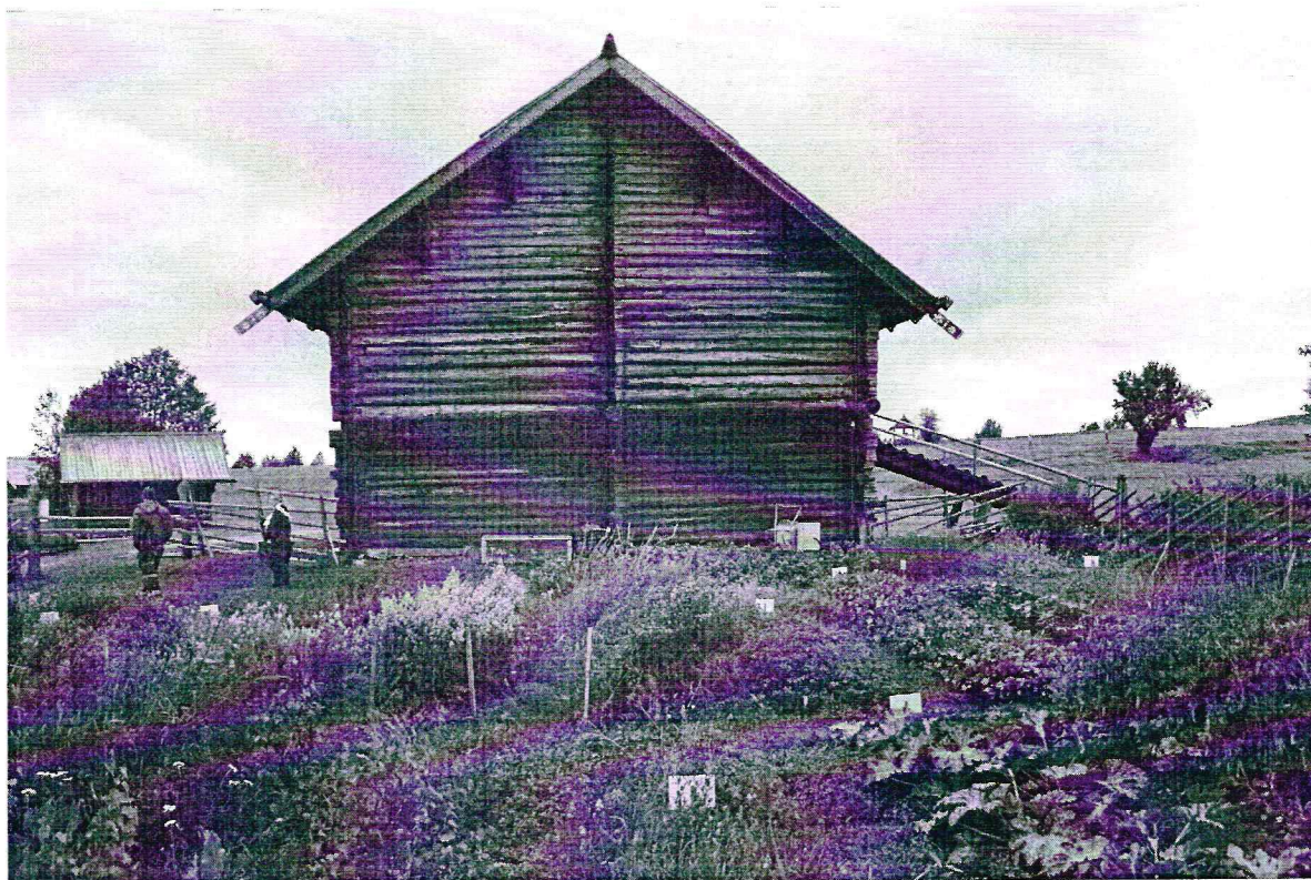
«Дом Яковлева из деревни Клешейла», Республика Карелия, Медвежьегорский район, о. Кижы. Восточный фасад. Дата: 2016 г.