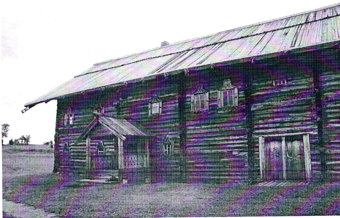
«Дом Яковлева из деревни Клещейла», Республика Карелия, Медвежьегорский район, о. Кижь. Южный фасад. Дата: 2016 г.