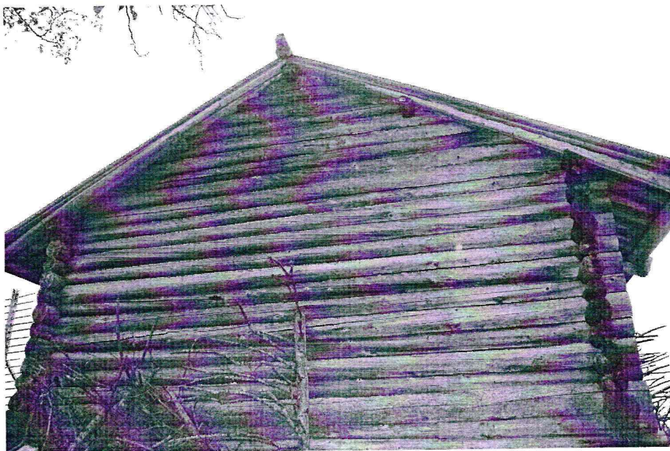
«Рига Стафеева из урочища Березовая Сельга», Республика Карелия, Медвежьегорский район, о. Кижь. Вид с востока. Дата: 2016 г.