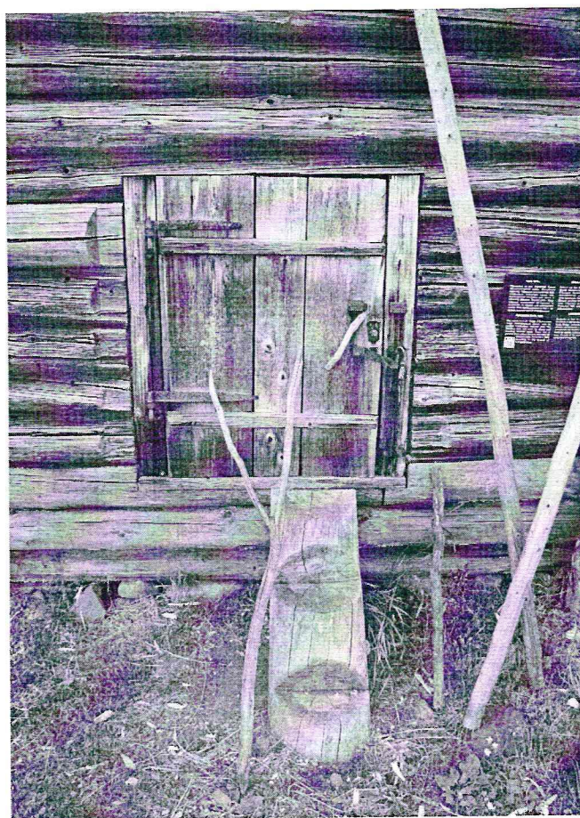
«Рига Стафеева из урочища Березовая Сельга», Республика Карелия, Медвежьегорский район, о. Кижь. Трехкосящатая дверь на западном фасаде. Дата: 2016 г.